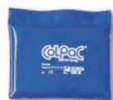
TE6025-23 Compressa de frio ColPac , refª. 1504 Quarto do tamanho 14 X 19 cm