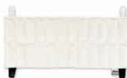
TE6025-05 Compressa de calor HotPac , refª. 1010 25 X 61 cm