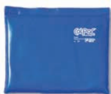
TE6025-21 Compressa de frio ColPac , refª. 1500 Standard 28 X 36 cm