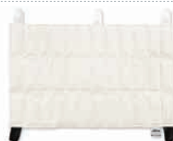
TE6025-02 Compressa de calor HotPac , refª. 1004 Tamanho grande 38 X 61 cm