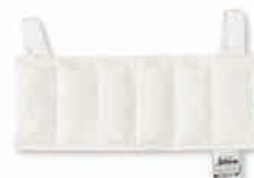
TE6025-27 Compressa de calor HotPac , refª. 1014 Tamanho médio 13 X 30 cm