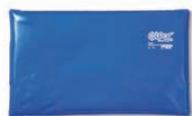
TE6025-27 Compressa de frio ColPac , refª. 1512 Tamanho grande 28 X 53 cm