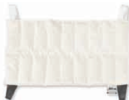
TE6025-04 Compressa de calor HotPac , refª. 1008 23 X 39 cm