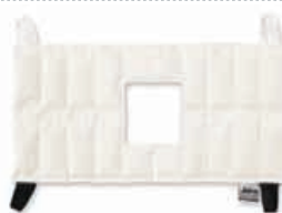
TE6025-06 Compressa de calor HotPac , refª. 1012 Joelho / Ombro 25 X 50 cm