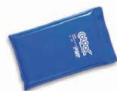
TE6025-24 Compressa de frio ColPac , refª. 1506 Tamanho médio 19 X 28 cm